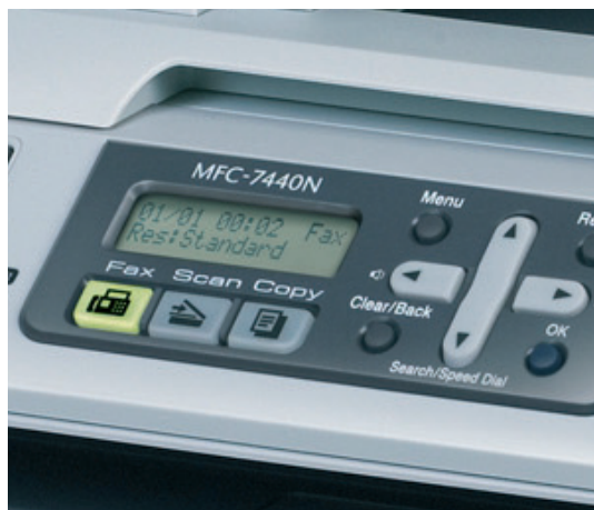
Добре видим задно осветен LCD дисплей.

Нещо повече, MFC-7840W идва с функция за сигурно функционално заключване. Това дава на администратора силата да реши кой потребител коя характеристика на машината може да използва; печат, копиране, сканиране, факс или PC-Fax. Достъп може да бъде даден лесно чрез използване на четирицифрен PIN код.