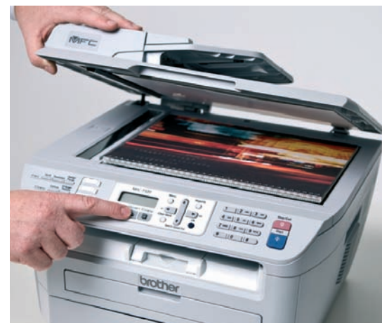
Висококачествено цветно или чернобяло сканиране.

Сканиране към FTP: тази функция Ви спестява време и усилия като Ви дава възможност да сканирате документите и изображенията си директно към FTP сървър (само в мрежа).