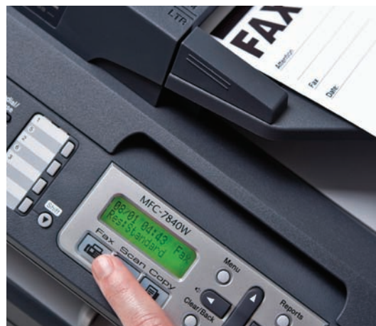
Автоматично листоподаващо устройство - идеално при изпращане на факс, копиране или сканиране на документи с много страници.