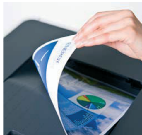
Двустранният печат намалява разхода на хартия

С функциите, които предлага и лесния за употреба начин HL-4150CDN намалява вашите разходи и спестява време в офиса.