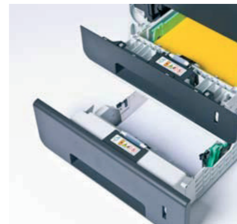
Добавете втора тава за хартия за повече удобство при работа